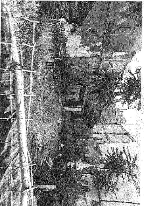
Solar ocupado por un mendigo en la calle de Jesús.